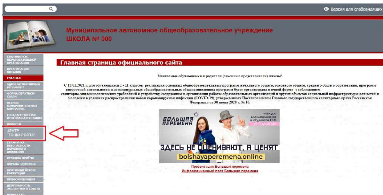
Рисунок 2. Пример размещения ссылки на раздел на сайте общеобразовательной организации

На официальном сайте общеобразовательной организации, в которой создается центр образования естественно-научной и технологической направленностей «Точка роста» (далее – центр «Точка роста», центр) в рамках федерального проекта «Современная школа» национального проекта «Образование», не позднее даты начала функционирования центра (не позднее 1 сентября года создания центра) создается раздел «Центр «Точка роста». Ссылка на раздел размещается в главном меню сайта общеобразовательной организации и должна быть видима при просмотре каждой страницы. Ссылка не может являться вложенной в другие меню. Пример размещения ссылки на раздел «Центр «Точка роста» в меню официального сайта общеобразовательной организаций в информационно-телекоммуникационной сети «Интернет» приведен на рисунке 2.